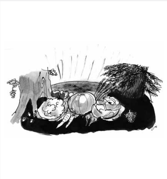
1 Tessalonicenzen 5,14-24